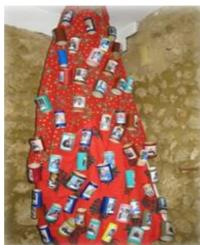
Árvore de Natal elaborada com material reciclado

Em nome de toda a equipa do Bloco da Quinta dos Inglesinhos, aqui deixamos votos de um Feliz Natal e um Bom 2012 .