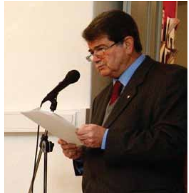
imagem_correio da mamã_20 janeiro 2012