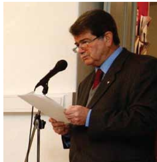
imagem_correio da manha_20 janeiro 2012

É nosso desejo dar a conhecer à opinião pública em geral, a relevância do nosso trabalho, que a par de muitas outras instituições cria condições de igualdade de oportunidades, a muitas crianças, jovens e adultos com deficiência intelectual e incapacidade.