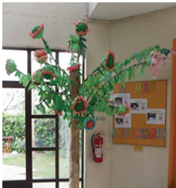
imagem_appacdm_primavera nas pedralvas