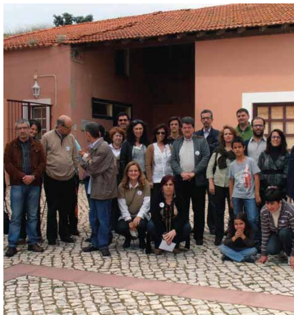
imagem_appacdm_encontro de irmãos